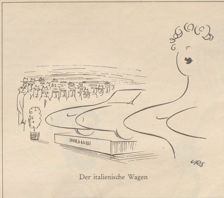
Der italienische Wagen

I wetti jo gwüß da Mediziinar nitt znooch trätta, abar untar üüs gsaid, as isch jo nu ai Fitamiin wichtig. zFitamiin B! B wie Bezüühiga. Im Tütscha dussa wärdand regal-määsig Umfrooga gmacht, zum Ärfaara, wiaviil Lütt mit Fitamiin B, ebba mit Bezüühiga, khaufandi. Vu zwaituusig wo man aagfroogat hätt, hend im Joor nüünzähahundertsächzig sexazwenzig Prozent mit Bezüühiga iarni Sahha khauft. Fasch dopplat soviil, wie im Joor vorhäär. Ma hätt dia zwaituusig au