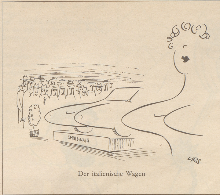
Der italienische Wagen

I wetti jo gwüß da Mediziinar nitt znooch trätta, abar untar üüs gsaid, as isch jo nu ai Fitamiin wichtig. zFitamiin B! B wie Bezüühiga. Im Tütscha dussa wärdand regal-määsig Umfrooga gmacht, zum Ärfaara, wiaviil Lütt mit Fitamiin B, ebba mit Bezüühiga, khaufandi. Vu zwaituusig wo man aagfroogat hätt, hend im Joor nüünzähahundertsächzig sexazwenzig Prozent mit Bezüühiga iarni Sahha khauft. Fasch dopplat soviil, wie im Joor vorhäär. Ma hätt dia zwaituusig au