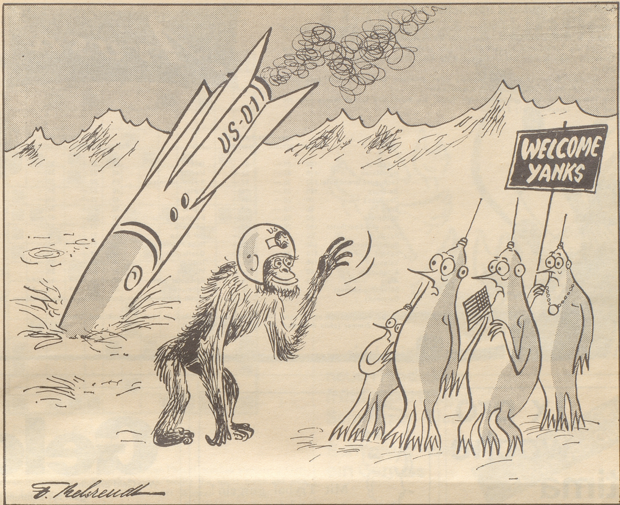
Die Wesen auf dem fernen Planeten: «Offengestanden, wir haben uns die Amerikaner ein bißchen anders vorgestellt!»