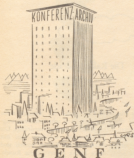
Das Erbe von Genf