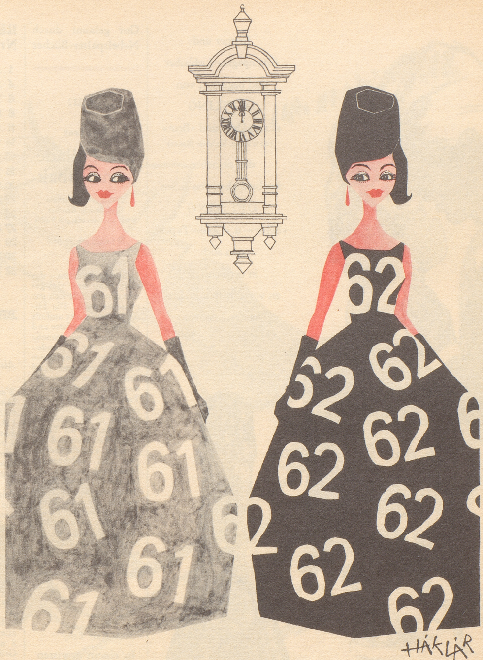
Départ und arrivée