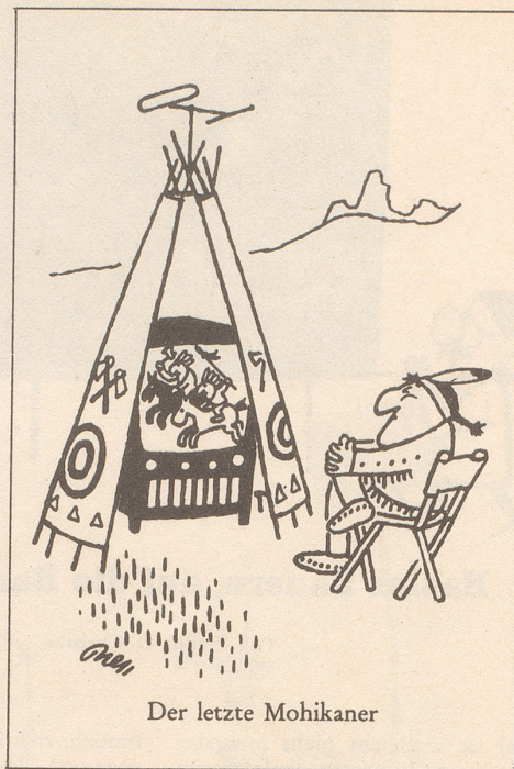
Der letzte Mohikaner

Im Land herrscht infolge Verstaatlichung der kleinen Betriebe ein empfindlicher Mangel an Dienstleistungsbetrieben. So gibt es in einem Bezirk in Nordböhmen in 133 Gemeinden nur 18 Coiffeurläden. Allerdings ist einzuräumen, daß diese Barbieri ein sehr leichtes Leben haben, sie brauchen die Köpfe nicht zu befeuchten und zu kämmen, bevor sie die Haare schneiden können. Denn ob den Zuständen in ihrem Land stehen den Tschechen die Haare von selbst zu Berge.