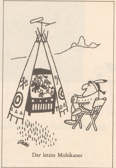
Der letzte Mohikaner

Im Land herrscht infolge Verstaatlichung der kleinen Betriebe ein empfindlicher Mangel an Dienstleistungsbetrieben. So gibt es in einem Bezirk in Nordböhmen in 133 Gemeinden nur 18 Coiffeurläden. Allerdings ist einzuräumen, daß diese Barbieri ein sehr leichtes Leben haben, sie brauchen die Köpfe nicht zu befeuchten und zu kämmen, bevor sie die Haare schneiden können. Denn ob den Zuständen in ihrem Land stehen den Tschechen die Haare von selbst zu Berge.