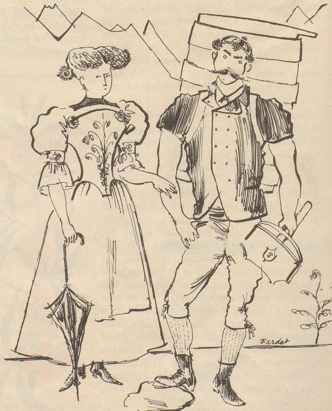
Gute alte Zeit: Aus einem alten Lexikon Schweizer Ehepaar

Liebes Bethli! Gestern passierte mir etwas, das ich Dir unbedingt erzählen muß. Ging ich da fröhlich in ein Sportgeschäft unseres kleinen Städtchens, um mir ein Paar Schlittschuhe zu kaufen. Als Verkäufer amtierten zwei junge Herren. Ich komme also herein und sage: «Ich hätte gern ein Paar Schlittschuhstiefel.» Darauf kommt die Frage: «Für Ihr Kind?» (Ich bin unverheiratet, was er natürlich nicht wissen konnte.) Ich sagte also nein, sie wären für mich. Aber nun geht das Verhör weiter: «Die Stiefel müssen wohl gut und fest sein, das sind ja wohl die letzten die Sie kaufen!» Und nun muß ich erwähnen, daß ich eigentlich erst 34 Jährchen auf dem Buckel habe, und meine paar grauen Fäden konnte er ja nicht sehen, ich hatte meine violette Wollkappe an. Nachher sagte er noch: «Stunden werden Sie ja keine mehr nehmen?» Doch ich wagte noch mit knapper Not zu sagen, ich hätte ein paar Stunden