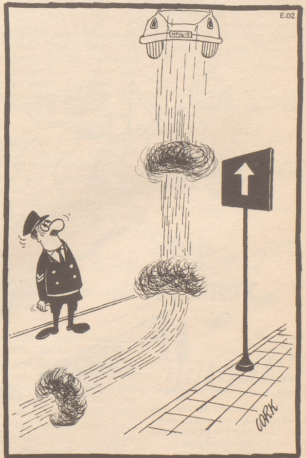
Angst vor der Obrigkeit