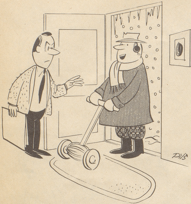
«Ich bringe Ihnen Ihre Mähmaschine mit bestem Dank zurück!»