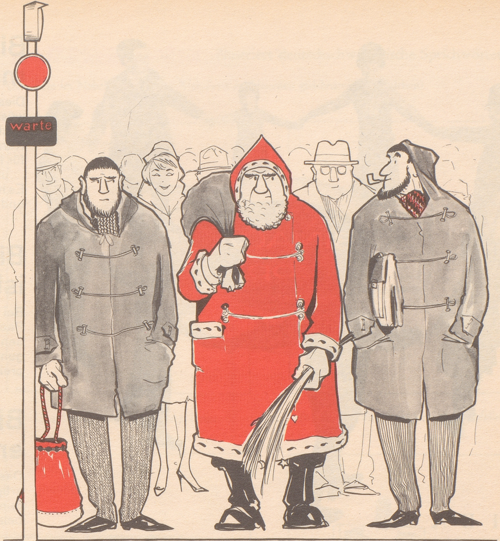
Chlaus und Chläus

Item. Man ist gegenüber einer Re- klame, die das biblische Vokabular benützt, immer etwas mißtrauisch, und man ist geneigt, dazu mit 2. Petr. 3/17 zu sagen (und auf herumsprechende Erkenntnis zu hoffen): «Ihr aber, meine Lieben, weil ihr das wisset, so verwahrt euch, daß ihr nicht durch den Irr- tum der ruchlosen Leute samt ihnen verführt werdet ...» BK