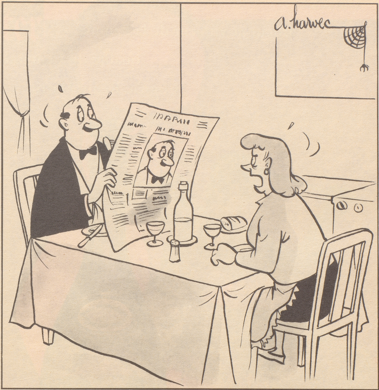
«Dasch s erschmal sit langem daß ich Dis Gsicht gsee am Tisch.»