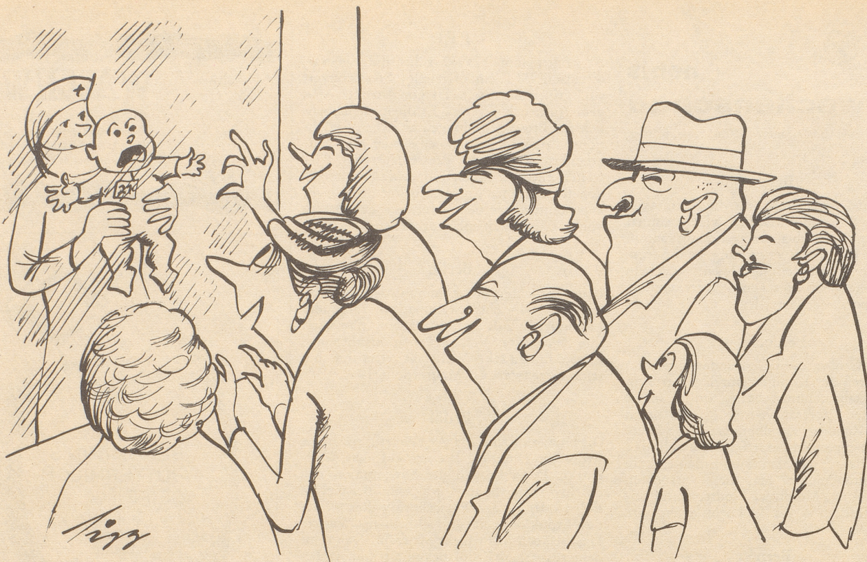
Junger Mensch macht erste Bekanntschaft mit Verwandtschaft