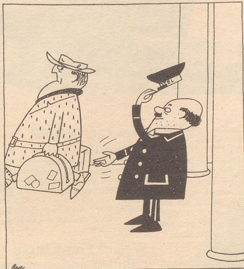
De Schwizer sait Glück und meint Geld