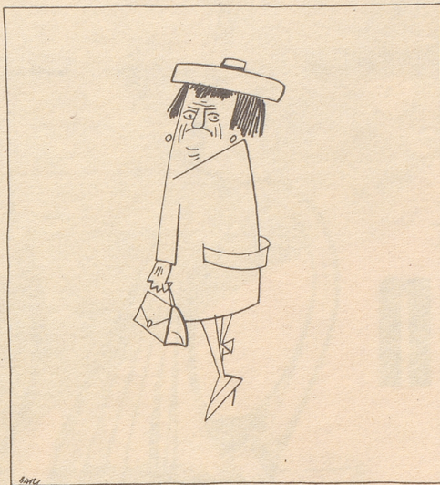
Jungi Wiiber und alti Hüser gänd Arbet

(Aus dem im Nebelspalter-Verlag Rorschach erschienenen gleichnamigen Bändchen)