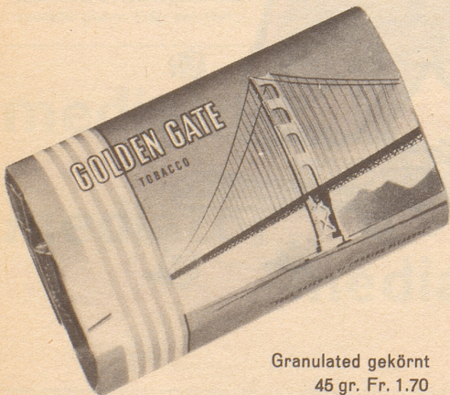
Granulated gekörnt 45 gr. Fr. 1.70

Granulated gekörnt oder Cavendish-Feinschnitt 300 gr. Fr. 10.50