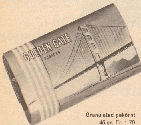
Granulated gekörnt 45 gr. Fr. 1.70

Granulated gekörnt oder Cavendish-Feinschnitt 300 gr. Fr. 10.50