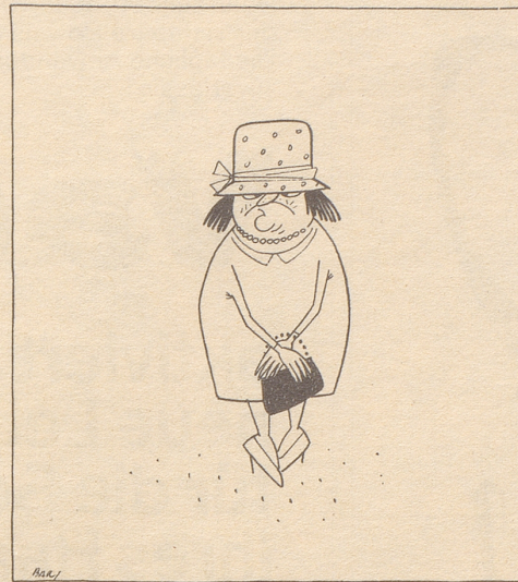
Nid under jedem Hüübli schtecket es Tüübli

(Aus dem im Nebelspalter-Verlag Rorschach erschienenen gleichnamigen Bändchen)