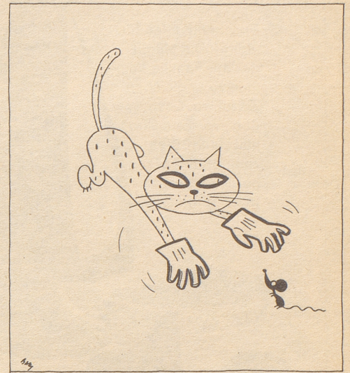
e Chatz mit Häntsche fangt kei Müüs