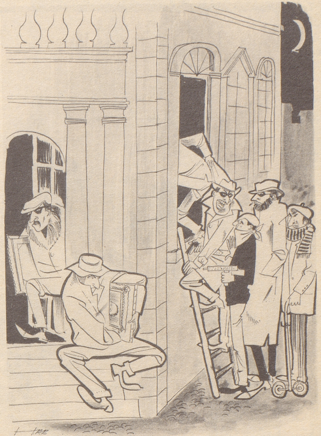
Bilderdiebstahl am laufenden Band

Der alte Farmer Smith kommt zum ersten Mal in die Großstadt und