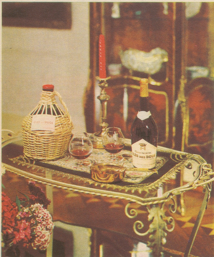
Armagnac CLES DES DUCS

Es heißt zwar: «Nichts Neues unter der Sonne», doch hat irgend jemand schon einen Jäger gesehen, der von einem toten Fuchs gebissen wurde? HS