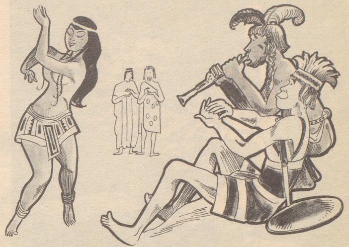
Tanz der Wilden