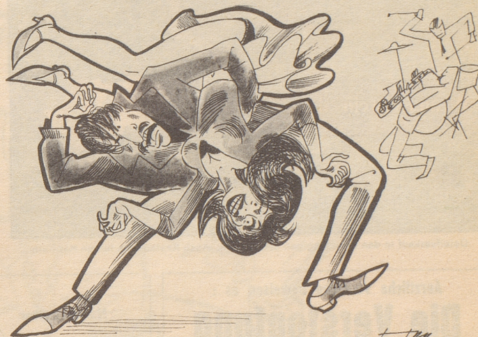
und der Zivilisierten