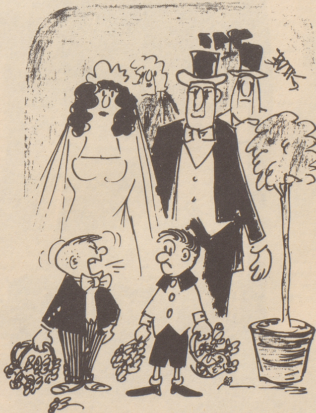
«Uusgrächnet jetzt wo Züri gege Basel schpillt müend die beide hüürate!»

B Rorschach Hafen Bahnhof Buffet H. Lehmann, Küchenchef