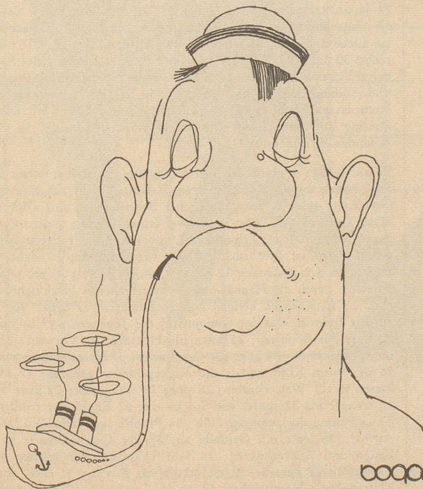
Seemann a. D.

Chruschtschow: «Gebe ich nicht das beste Beispiel für praktische Abrüstung!? Habe ich doch schon 19 meiner H-Bomben vernichtet!