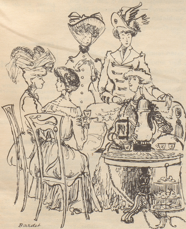
Die Kaffeekochmaschine, die Sensation des Kaffeekränzchens.