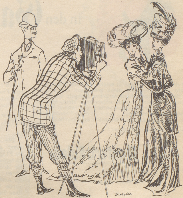
Der erste Kinematograph.