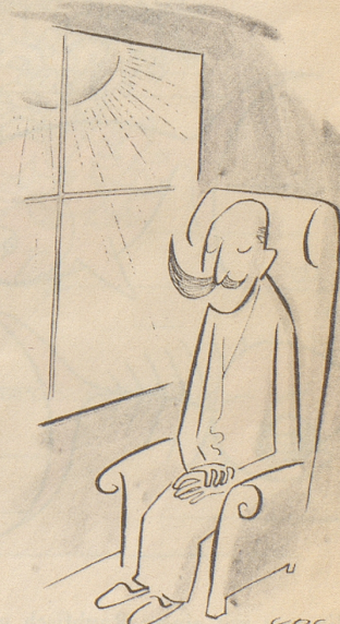
Ohne Sonne gedeiht nichts