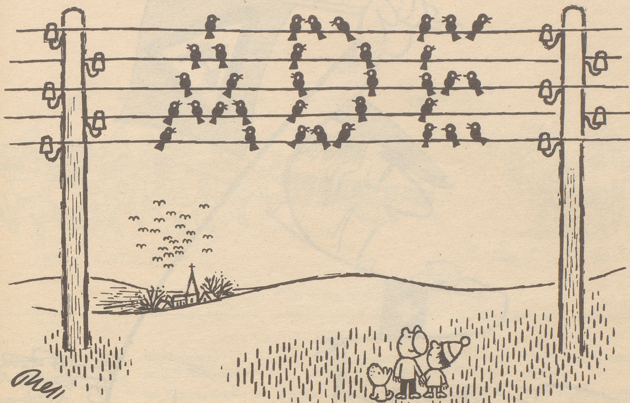
Sammlung vor dem Abschied