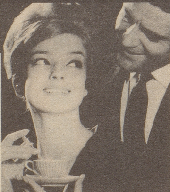
Ich verwende jetzt eben Pepsodent