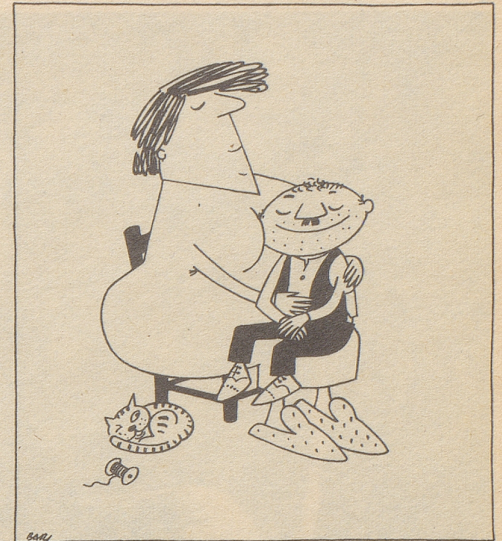
Bi de n Alte isch me ghalte!

Die ostzonale Zeitung «Junge Welt» prangert die westliche Dekadenz in einem offenen Brief an die vor einem Jahr aus Ostdeutschland geflüchtete und inzwischen zur «Miß World 1961» gewählte Marlene Schmidt an. «Bei uns in der DDR», heißt es, «warst du als Ingenieur geschätzt. Im Westen aber fanden nur Dein Busen (95 cm), Deine Hüften (95 cm) und Deine Taille (58 cm) Bewunderung.»