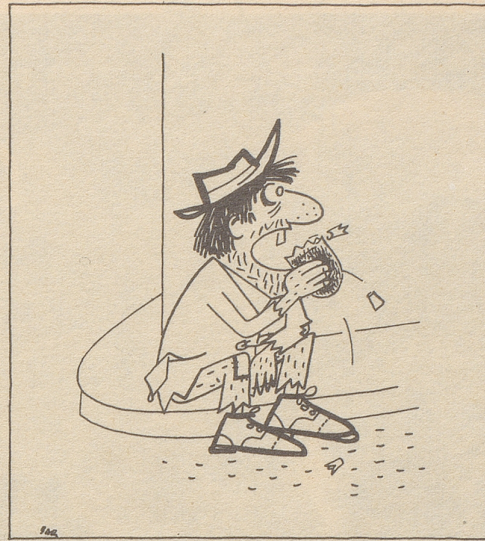
i dr Not gits kei härts Brot