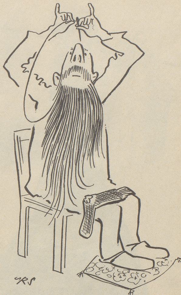
Wenn Männer flicken

aus Reader's Digest kennen Sie ja. Ob es wirklich das Beste ist, darüber befindet jeder selber. Was aber ist «das Schönste»? Für den einen die Alpen, für den andern das Meer und für den dritten der rassige Sportwagen, für den vierten der Himalaja und für den fünften seine Jacht. Und für überaus viele die prachtvollen Orientteppiche von Vidal an der Bahnhofstraße in Zürich!