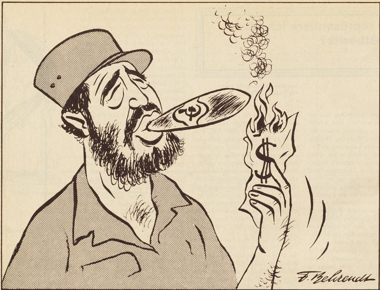
Die neue Havanna - scharfer Tabak