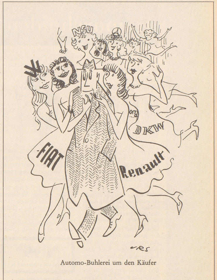
Auto-mo-Buhlerei um den Käufer