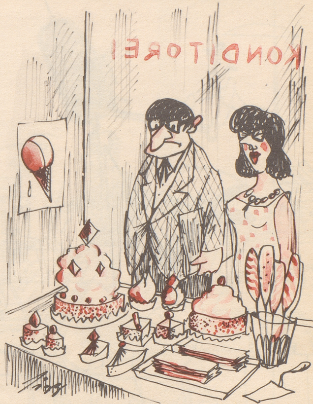
Die Inspiration des Architekten

«Da kommt mir grad eine neue Idee für einen Kirchenbau!»