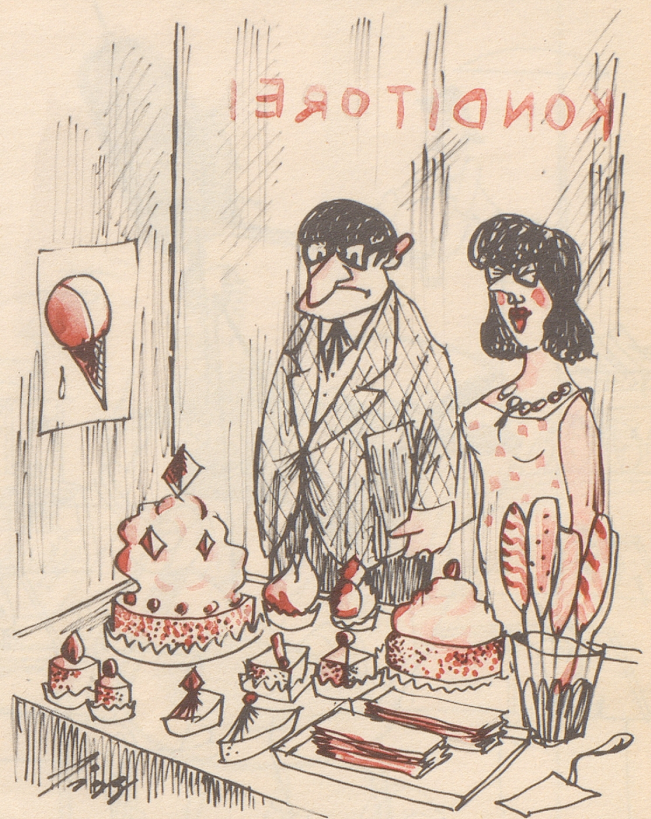
Die Inspiration des Architekten

«Da kommt mir grad eine neue Idee für einen Kirchenbau!»