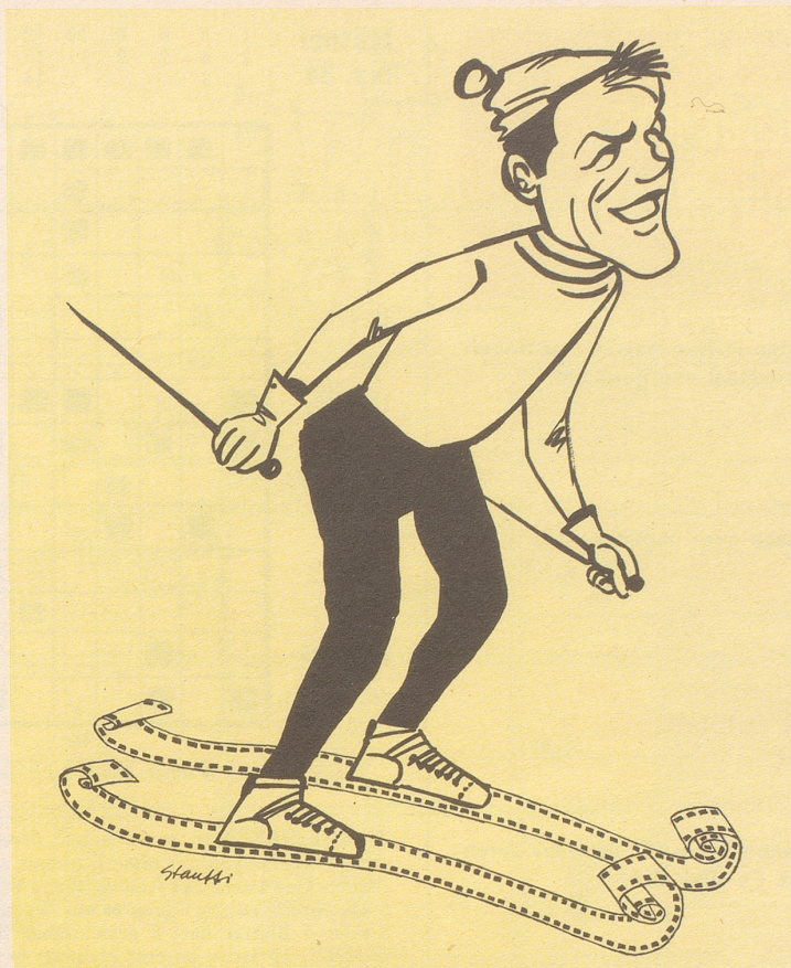
Roger Staub geht zum Film - auf die neuen Bretter, die die Welt bedeuten!