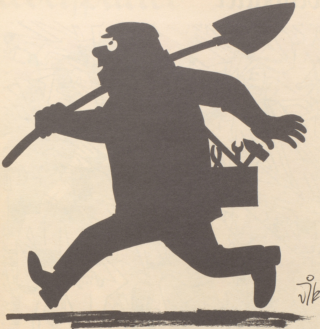
Der samstägliche Schwarzarbeiter