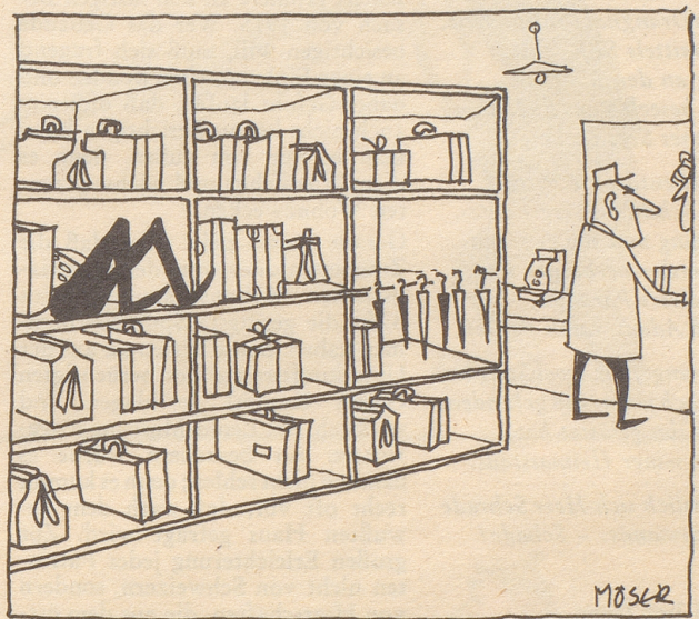
Albert jr. erlebte diese Woche ...