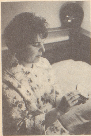
LAEVORAL verschafft rasch neue Kräfte

wertvoller Energiespender für Automobilisten