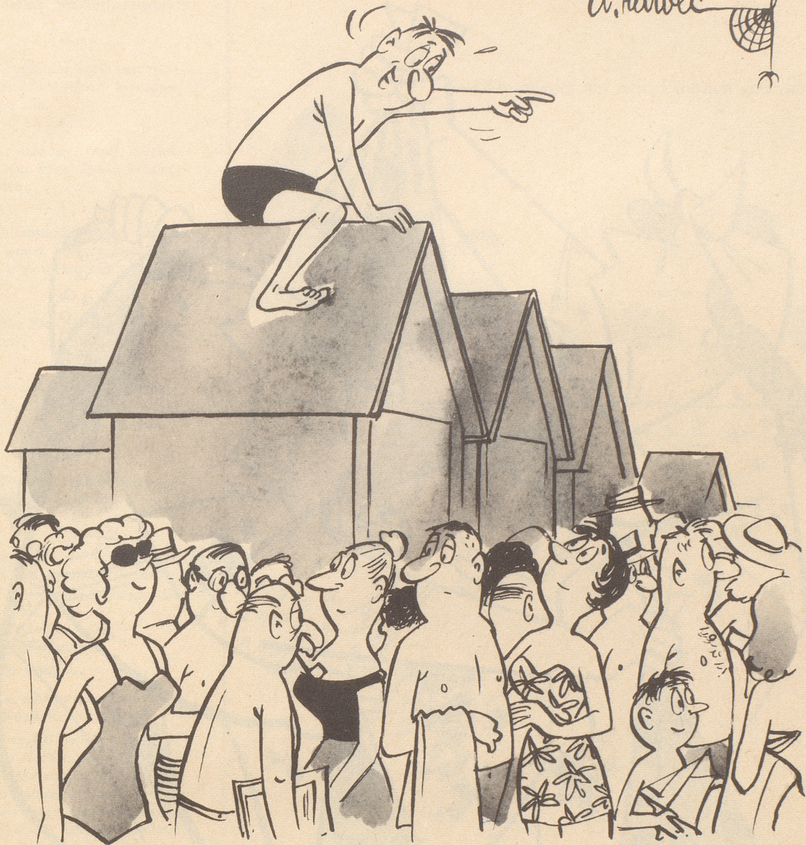
«Das Wasser befindet sich dort!»

schütten sie einen mit Geschenken. Fehlt mir bloß noch ein Lastwagen für den Geschenktransport.» Eisenhower, sein Nachfolger, hat nie etwas angenommen, wenn er «eigen-nützige Motive» vermutete, angelte sich aber dennoch im Rahmen des Erlaubten Pferde, Rinder, Schafe und Hühner für seine Farm, einen Traktor, Biberfelle für «Mamie», einen Golfklub. Präsident Grant nahm grundsätzlich alles von der Zigarre bis zur Villa an und hielt laut einem Historiker «stets beide Hände auf». Präsident Jefferson dagegen nahm überhaupt nichts an und bezahlte sogar einen von hol-