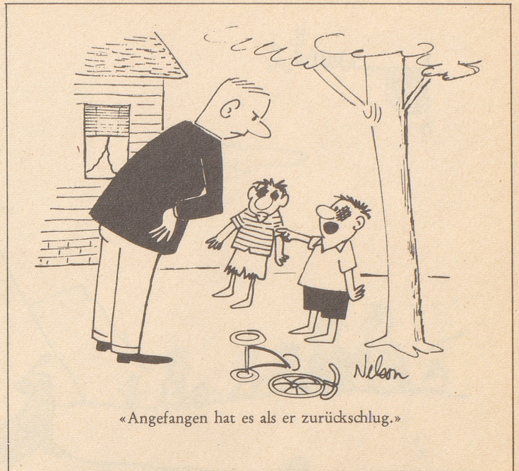
«Angefangen hat es als er zurückschlug.»

Feuer breitet sich nicht aus, hast Du MINIMAX im Haus!