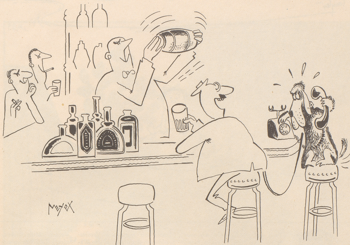
Karo telefoniert Frauchen, es soll Herrchen heimholen

der Sonne hörte er sein eigenes Fett brodeln.» Das passiert uns Durchschnittskaltblütlern auf heimischen Breitengraden nicht; allenfalls bringt die ungebürstete Sprache unseres Dichters gelegentlich unser Blut zum Brodeln.