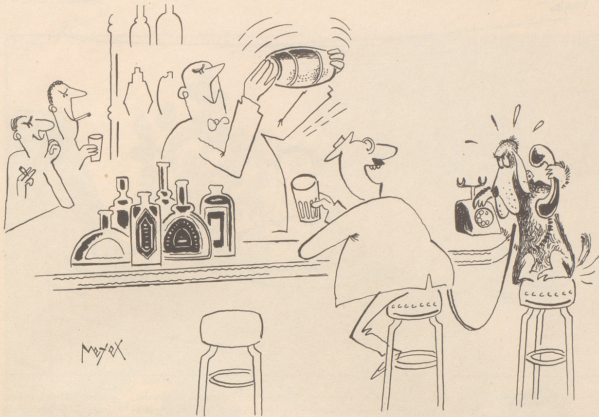
Karo telefoniert Frauchen, es soll Herrchen heimholen

der Sonne hörte er sein eigenes Fett brodeln.» Das passiert uns Durchschnittskaltblütlern auf heimischen Breitengraden nicht; allenfalls bringt die ungebürstete Sprache unseres Dichters gelegentlich unser Blut zum Brodeln.