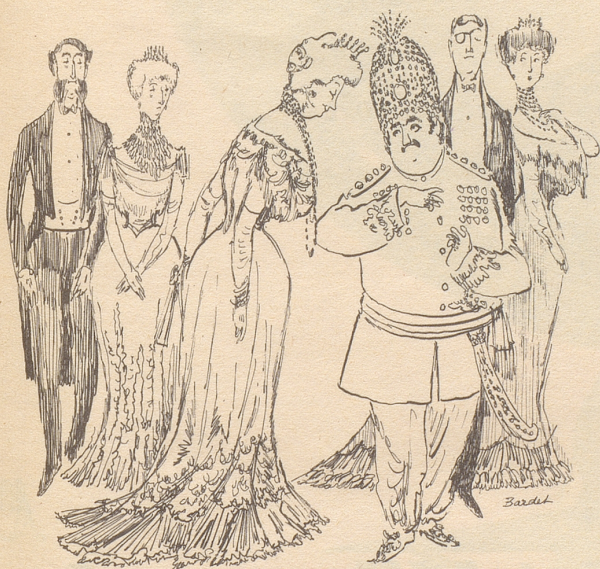
Höhepunkt einer Soirée: Der fremde Fürst