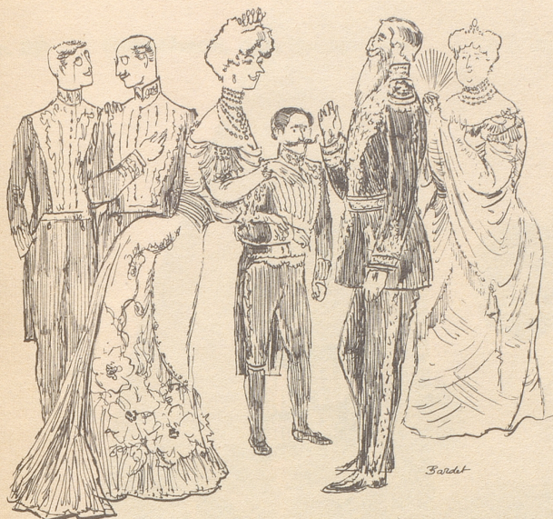
Diplomaten und schöne Frauen machen Geschichte