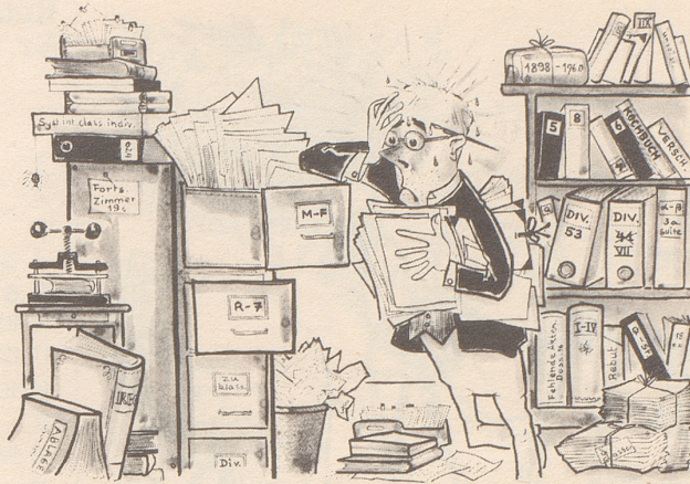
«Wenn i wüßt was i suech so wüßti wos ischt.»

EFTA-Gebiet vorstoßen. Es ist daher in Mittel-EFTA mit böigen Winden und Niederschlägen zu rechnen, während das östliche EFTA-Gebiet mit zeitweisen Aufhellungen rechnen kann. Eine vorübergehende Aufheiterung verbunden mit Druckanstieg im zentralen Commonwealth-Raum vermag zwar die EWG-Randgebiete zu erreichen, dürfte jedoch die Gesamtwetterlage bei der EFTA nicht nachhaltig beeinflussen.»