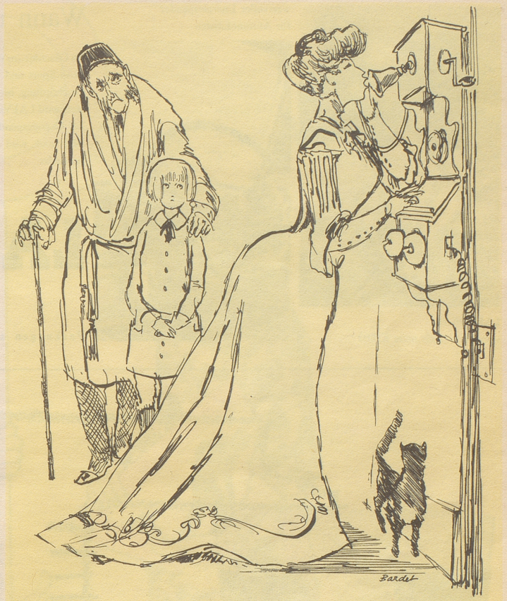
Vom Siegeszug der Technik um 1900

Leitige Geschwüre bekämpft auch bei veralteten Fällen die neuartige, in hohem Maße schmerzstillende Spezial-Heilsalbe «BUTHAESAN». Machen Sie einen Versuch. 3.65, 5.70 in Apoth. Vorteilh. Kliniktopf (fünffach) 22.50 dch. St. Leonhards-Apoth., St. Gallen. Buthaesan.