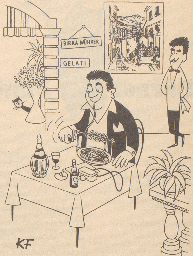
Keine Schwierigkeiten mehr beim Spaghetti-Essen

Feuer breitet sich nicht aus, hast Du MINIMAX im Haus!