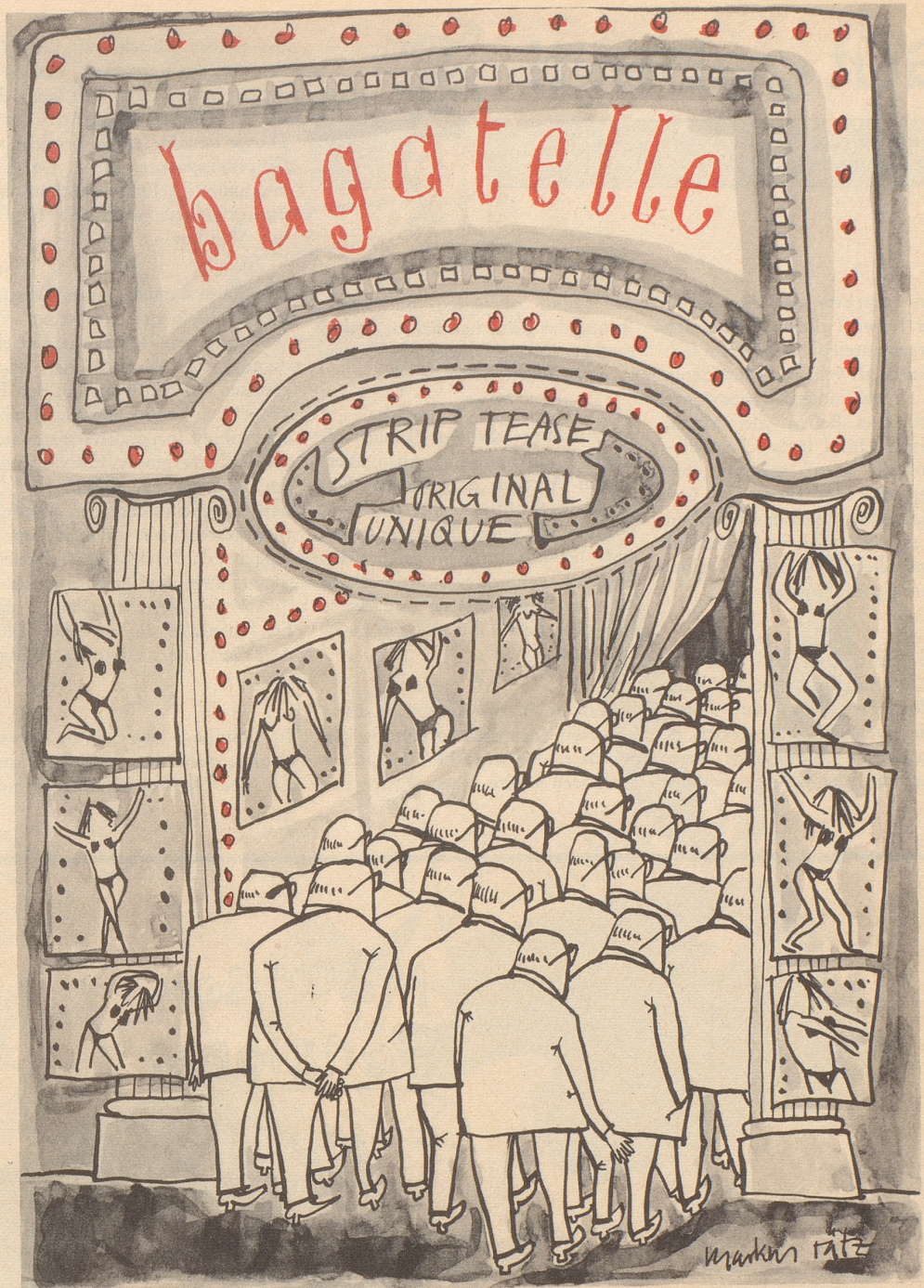
Ein Verein in Paris