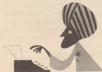
....für meinen Harem noch eine....*

verführte die Schönen seiner Epoche zu hunderten. Ob er dies mit schmeichelnder Rede tat, oder mit nachher nicht eingehaltenen Versprechungen, wissen wir nicht. Was wir ganz sicher wissen ist nur, daß er Ihnen auf keinen Fall Orientteppiche von Vidal an der Bahnhofstraße 31 in Zürich versprechen konnte. Diese prachtvolle Auswahl steht uns erst in unserem Jahrhundert zur Verfügung!