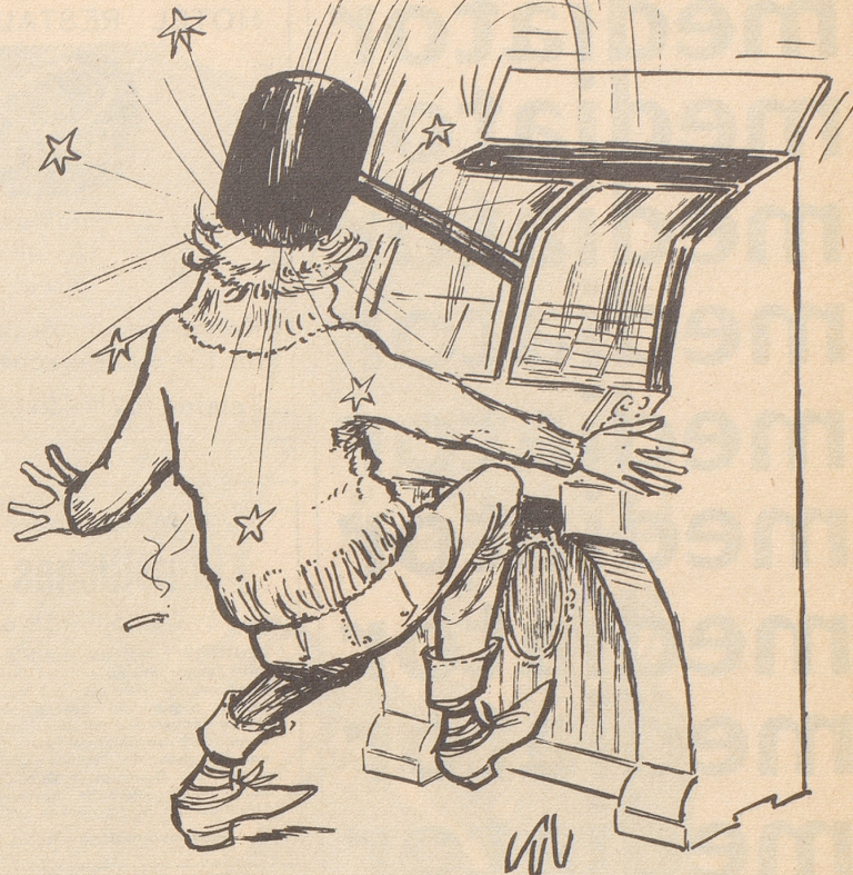
Aus unserer Erfindermappe