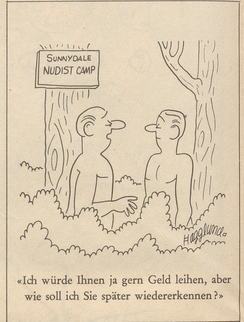
«Ich würde Ihnen ja gern Geld leihen, aber wie soll ich Sie später wiedererkennen?»

Mein lieber Freund, Du hast mich eingeladen, mit Dir und einem Dutzend Kameraden am Sonntag an den Fußballmatch zu kommen. Hab Dank! Ich hätte gerne teilgenommen, doch leider muß ich mich davon enthalten und mir den Sonntag anderswie gestalten. Du wirst den Grund begreifen: Ich kann nicht pfeifen. fis