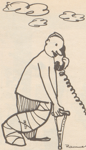
«Falsch verbunden? Wieso wissen Sie das?»

Aretino verzog sich schleunigst und nahm sich vor, keinen Menschen mehr zu verspotten, der auf solche Art Maß nahm.