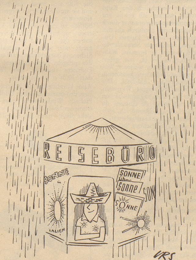
Wirkung der Reklame