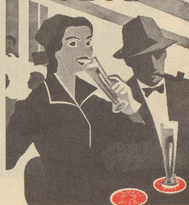
Das Boulevard-Restaurant in Chur