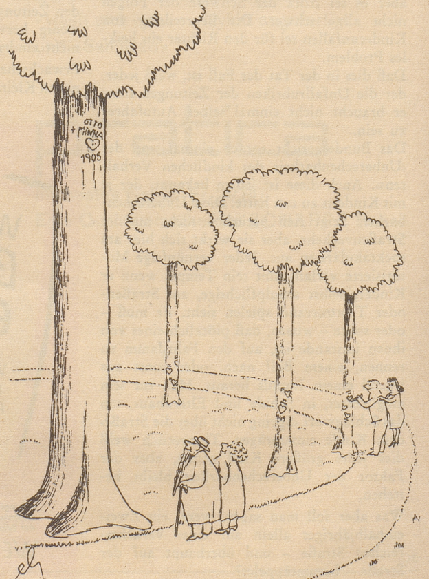
Wie doch die Jahre vergehen!

In einem der berühmtesten Hotels von Genf war ein großer Ball zugunsten eines wohlthätigen Zwecks vorgesehen, und so wollte denn auch eine mir bekannte Dame eine riesige Wurst spenden, die irrtümlicherweise in ein anderes, auch sehr berühmtes Hotel getragen wurde. Just zu jener Zeit aber war der amerikanische Vizepräsident in diesem zweiten Hotel abgestiegen, und die seltsame Wurst ohne Ziel und Zweck, wie es schien, erweckte Verdacht. So kam es, daß die Stifterin, als sie ihre Gabe abholen wollte, um sie an den richtigen Bestimmungsort zu tragen, die reichlich komische Auskunft erhielt,