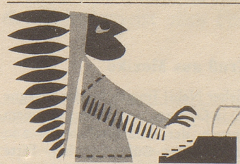
...ich, der "Grosse Bär", Häuptling der tapfern...*